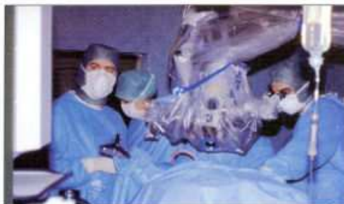
Le Neuro Navigateur

Les équipements innovants et de recherche sont de plus en plus coûteux. Leur acquisition rapide au bénéfice des patients s'impose mais les hôpitaux ne peuvent pas seuls y parvenir.