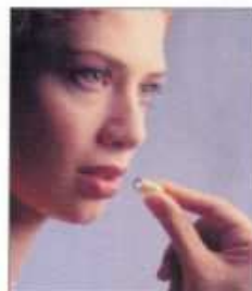
Capsule de vidéo-endoscopie

En 15 ans vos dons ont permis l'acquisition d'une soixantaine de matériels innovants et de recherche permettant notamment :